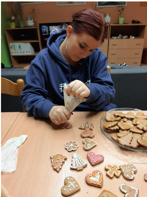
Výroba a zdobení vánočních perníků na Jarmark 2019 Albert Opava