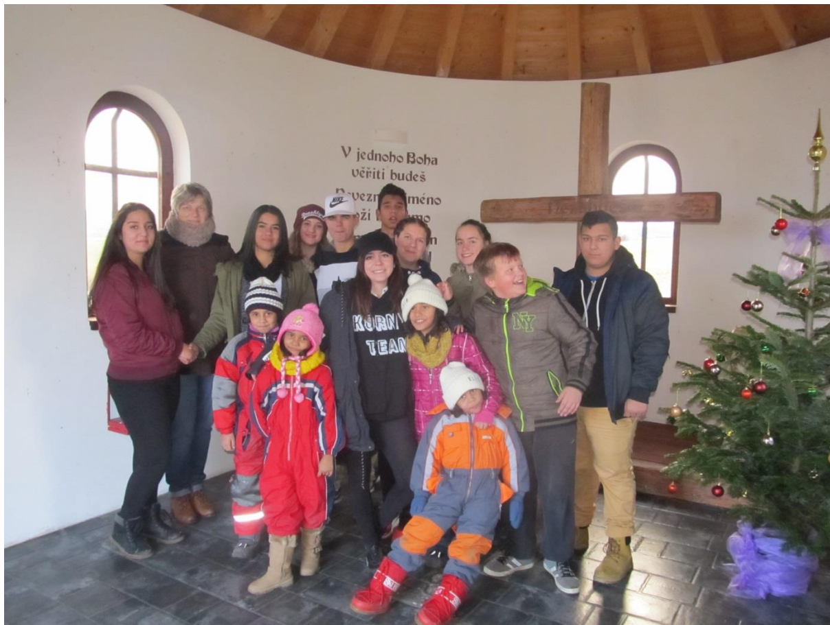
Vánoce v penzionu Nad stáji Jakartovice