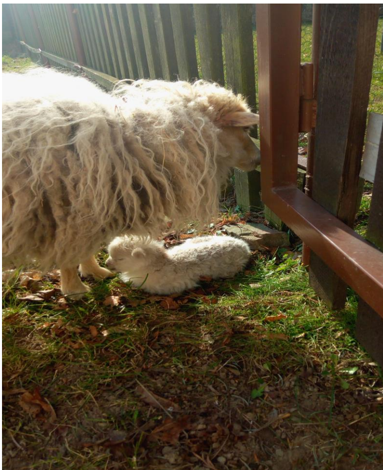
„Narození jehňátka na DD“

Zámecký park je specifikem našeho zařízení a je součástí každodenního života. Přispívá ke zdravému vývoji dítěte, nabízí mnohostranné využití ve volném čase, prostory k pohybovým hrám, procházkám, sběr hub, ořechů a kaštanů, které odevzdáváme do mysliveckého spolku. Víceúčelové hřiště při DD je denně využíváno ke hře či tréninku ve fotbale, vybíjené, volejbale, banbingtonu, tenise, košíkové. Pořádají se zde tradiční sportovní akce pro spřátelené dětské domovy v MSK, vybíjená, vodní fotbálek. V zimním období slouží jako ledová plocha k bruslení. Rozloha parku umožňuje dětem zdokonalovat jízdu na kolech, před samotným výjezdem na silnici. Je zde pískoviště pro nejmenší děti, trampolína, herní prvky a bazén, který v letním období poskytuje zábavu a vodní radovánky. Prázdninové večery trávíme u krbu, kde si děti opékaly špekáčky a zaspívaly za doprovodu kytary. V zimním období si děti užívaly sněhu, nejmenší se učili lyžovat, jízdě na snowboardu. Vychovatelé připravily závody v jízdě na bobech a soutěž „O nejlepší stavbu ze sněhu“, letos nám sněhové podmínky přály. Zalyžovali jsme si ve ski areálu v Tošovicích, Kopřivné a podnikli jsme celodenní výlet s výstupem na horu Praděd – akci uspořádal dětský domov ve Vrbně pod Pradědem.