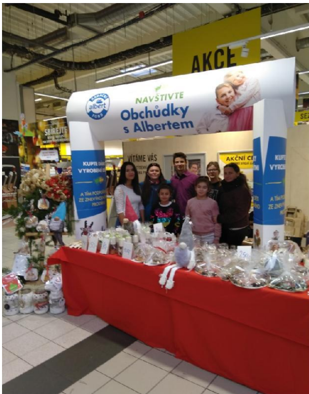
Prodej výrobků Jarmark 2019 Albert Opava