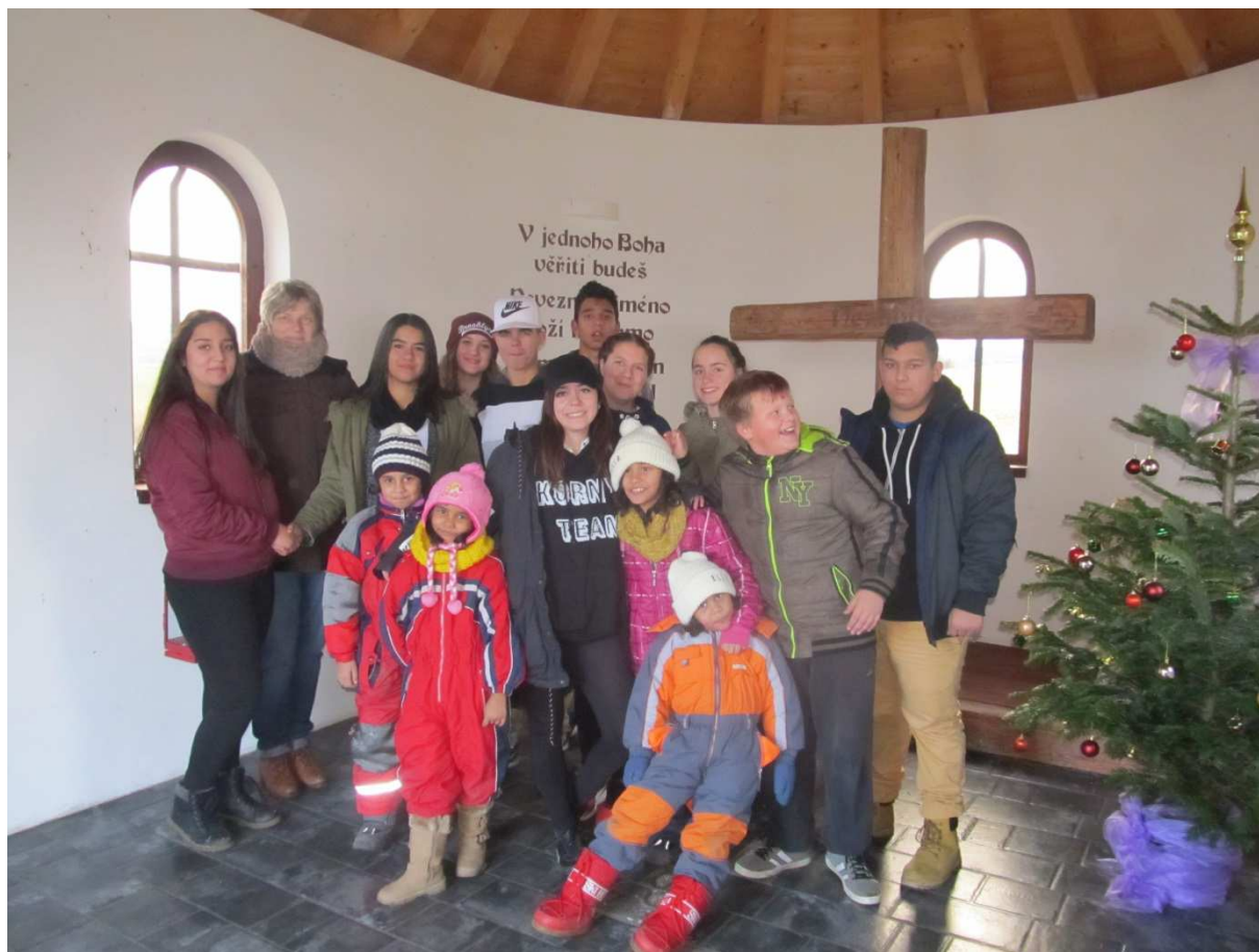
vánoce v penzionu Nad stájí Jakartovice