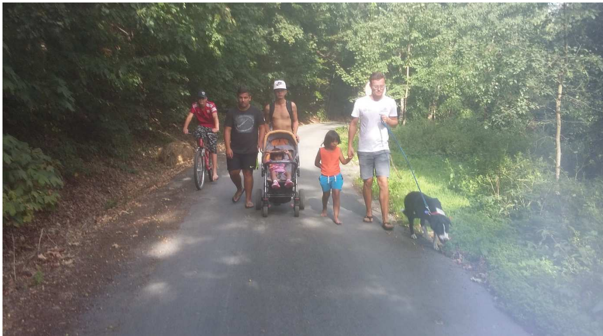
„ Společná vycházka „

Velká akce, která proběhla na našem dětském domově ve školním roce 2018/2019 bylo: