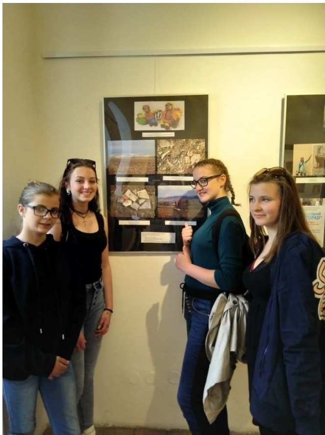
„To je hlína, umělecká přehlídka“