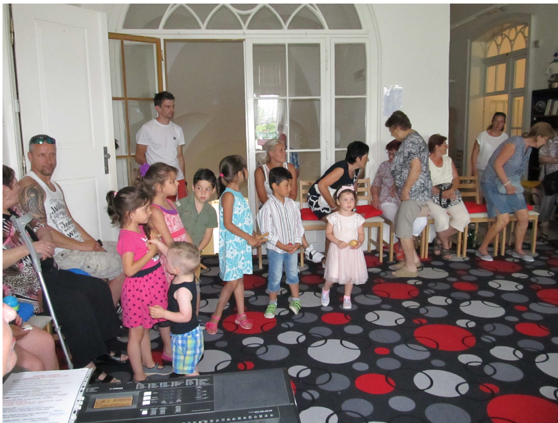
Vystoupení nejmladších dětí s programem