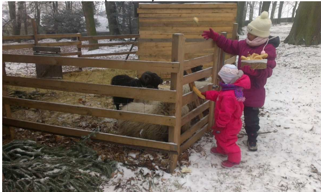
„Krmení oveček suchým pečivem“

za pomoci vychovatele. Pravidelně jsme třídili odpad, sbírali papíry v okolí budovy i obci. V celorepublikové úklidové akci „Uklidme Česko“ děti vyčistily příkopy okolo obce Melč a Zálužné. V zimním období chlapani odhrnovali sníh na terase a před budovou, pro zajištění bezpečnosti. Starší chlapani rádi pomáhali s umytím a údržbou domovních aut jako je umytí kapoty, vysávání, čištění oken. Společně se staráme o ovce, které spásají travní část areálu parku, šetříme tak čas a práci údržbáře a PHM do traktoru při údržbě parku. Děti získávají zkušenost s chovem, suší pečivo, kterým ovce krmí.