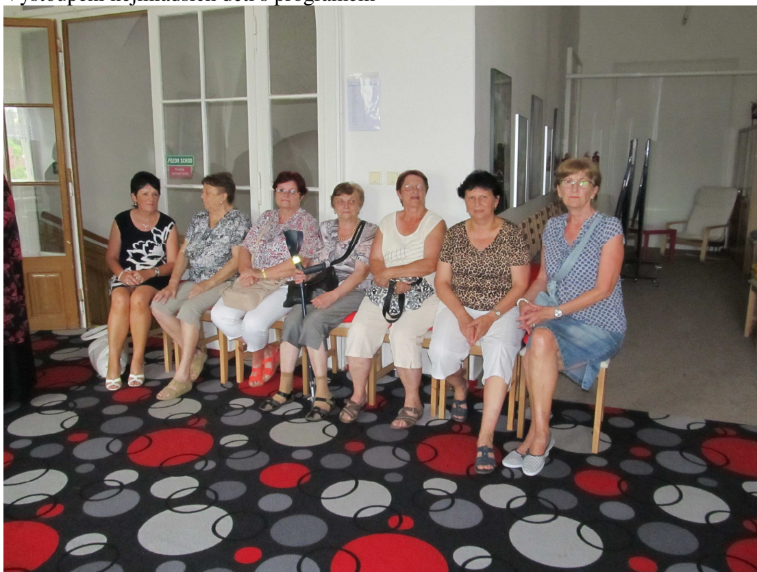
Bývalí pracovníci dětského domova