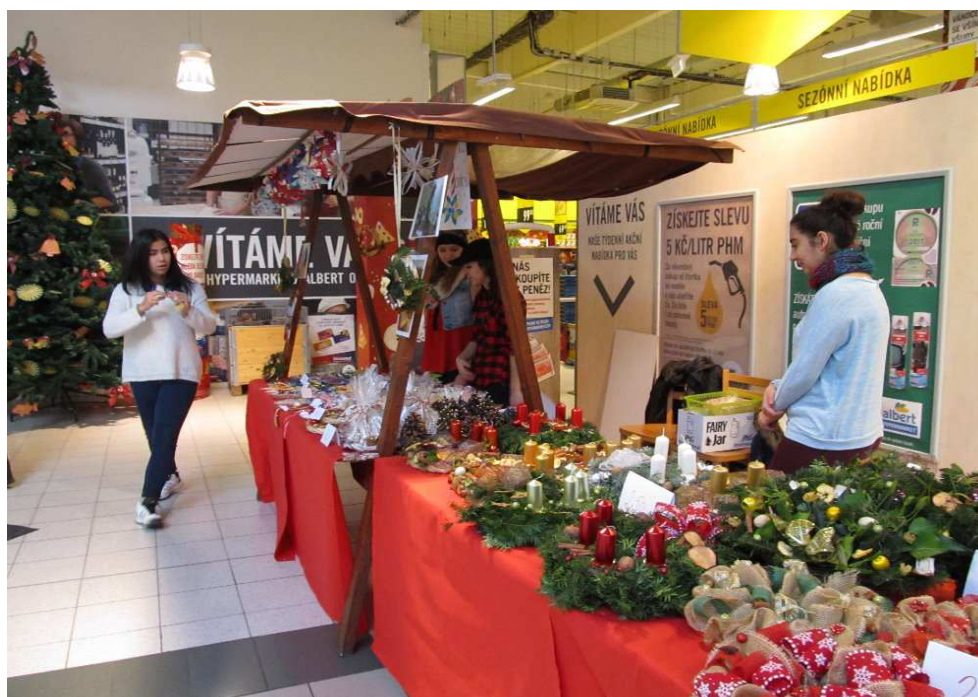
Jarmark v prodejně Albert v Opavě 1