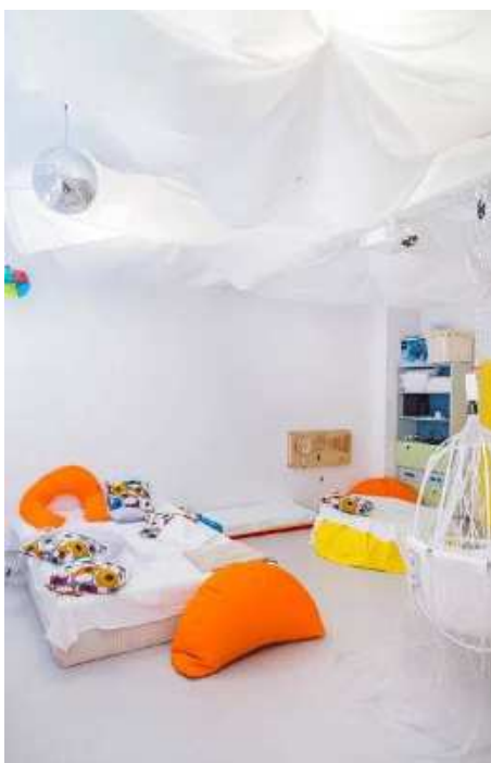
Obr. Ukázky možného řešení místnosti Snoezelen.

V současné době budujeme v našem dětském domově - Snoezelen , speciálně upravenou relaxační místnost, ve které lze využít technického vybavení k multismyslové stimulaci, jako jsou bublinkové vodní sloupky, hvězdné nebe, projektory, optická vlákna, aroma lampy, zrcadlová koule, speciální pohodlný měkký nábytek a další. Pomůcky slouží ke stimulaci smyslů nebo k relaxaci.